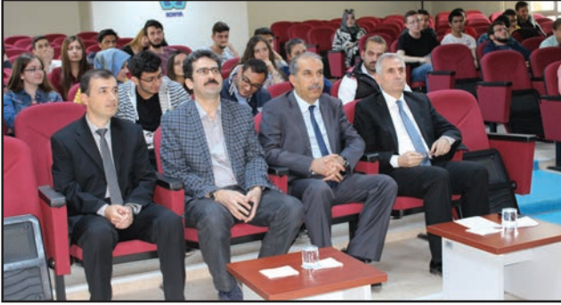
"2023 Hedefleri ve Verimlilik" konulu bilgilendirme toplantısı ilgiyle izlendi.