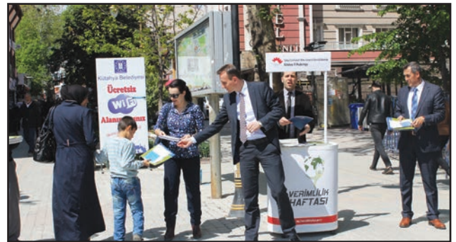
Kütahya Valiliği önünde açılan Verimlilik Farkındalık Standında vatandaşlara broşür dağıtıldı.

Kütahya BST İl Müdürlüğü, 28 Nisan 2016 tarihinde Valilik binası önünde Verimlilik Farkındalık Standı açarak il kamuoyunu verimlilik konusunda bilgilendirdi. VGM tarafından gönderilen broşür ve yayınlar halka dağıtıldı.