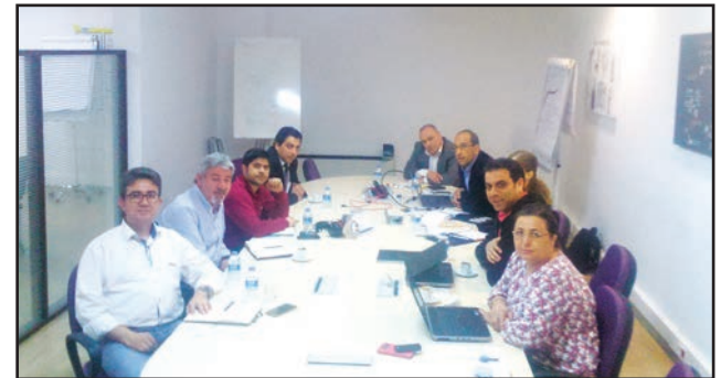
MaxionJantaş Jant San. ve Tic. A.Ş.

27 Nisan 2016 tarihinde Manisa Organize Sanayi Bölgesinde faaliyet gösteren ve enerji tüketimi yüksek olan MaxionJantaş, Selkasan ve Polinas Plastik firmalarının enerji birimi üst düzey ve teknik personeline yönelik interaktif toplantılar düzenlendi.