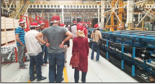
Öğrenciler, Asaş Alüminyum Fabrikası'ndaki üretim süreçlerini ilgiyle incelediler.

27 Nisan 2016 tarihinde Sakarya Üniversitesi öğrencilerine yönelik bir teknik gezi düzenledi. 2016 Verimlilik Proje Ödüllerinde dereceye giren Asaş Alüminyum fabrikasına yapılan teknik gezi sırasında öğrenciler ödüllü projeyi yerinde inceleme fırsatı buldular.