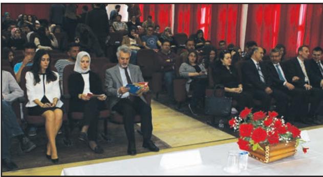
DPÜ Mühendislik Fakültesindeki seminere akademisyenler, öğrenciler ve iş adamları katıldı.