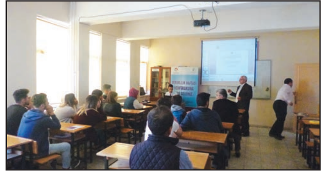
Rize Mesleki Eğitim Konferans Salonu

26 Nisan 2016 tarihinde Rize Mesleki Eğitim Merkezi'nde düzenlenen konferansa Mesleki Eğitim Merkezi Müdürü, merkez personeli ve kursiyerler katıldı.