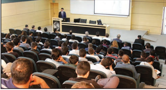
Sakarya Üniversitesi Kongre ve Kültür Merkezi'ndeki konferansa öğrenciler büyük ilgi gösterdi.

Sakarya Üniversitesi akademik personeli, öğrenciler, sanayiciler ve diğer katılımcıların yoğun ilgi gösterdiği konferans büyük beğeni topladı.