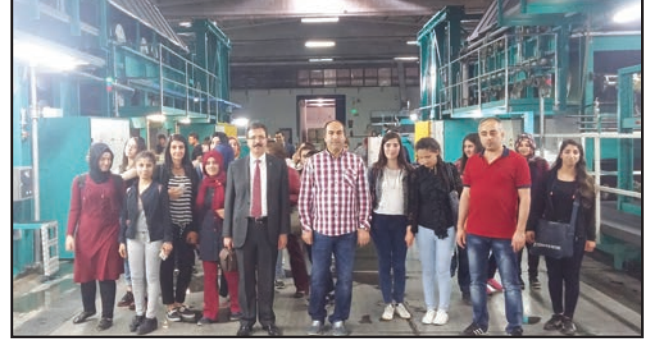
Çalık Denim-GAP Tekstil San. ve Tic. A. Ş. Tesisleri

düzenlendi. Ziyaret kapsamında öğrencilere pamuğun işlenmesinden ipliğe, ipliğin boyanması ve nihai olarak kumaşa dönüşüm aşamaları anlatıldı. Etkinlik kapsamında VGM tarafından hazırlanan hediye seti ve TÜBİTAK Bilim Teknik Dergisi öğrencilere dağıtıldı. İşletme yetkilileri öğrencilere Ar-Ge'nin öneminden bahsederek verimlilik haftası kapsamında farkındalık oluşturdular.