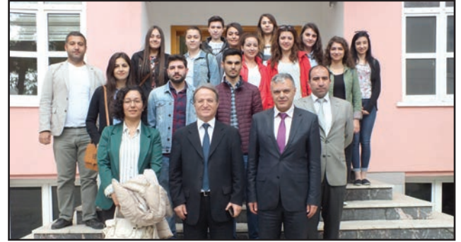
MKEK Mühimmat Fabrikası'na yönelik teknik geziye katılan Kırıkkale Üniversitesi Endüstri Mühendisliği bölümü öğrencileri.