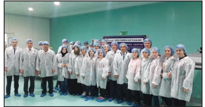
Ordu Üniversitesi Ziraat Fakültesi Gıda Mühendisliği öğrencileri için Sanset Gıda Ordu Üretim Tesislerine teknik gezi düzenlendi.