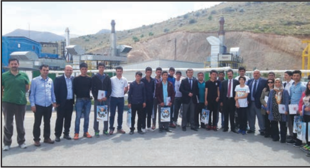
Malatya Büyükşehir Belediyesi Katı Atık Depolama Tesisi

İlk teknik gezi, 28 Nisan 2016 tarihinde Malatya BST İl Müdürlüğü, Milli Eğitim İl Müdürlüğü, Malatya Büyükşehir Belediyesi ve İnönü Üniversitesi işbirliğiyle gerçekleştirildi. Malatya Büyükşehir Belediyesi Katı Atık Depolama Tesisi ve İnönü Üniversitesi Güneş Enerji Santraline düzenlenen ilk teknik geziye Yunus Emre Mesleki ve Teknik Anadolu Lisesi Elektrik Bölümünde öğrenim gören 45 öğrenci katıldı. Ziyaret kapsamında öğrencilere katı atıklardan doğaya salınım yapan metan gazının verimli bir şekilde enerjiye dönüşüm aşamaları uygulamalı olarak anlatıldı. Geziye katılan öğrencilere VGM ve Malatya Büyükşehir Belediyesi tarafından hazırlanan hediyeler ile TÜBİTAK'ın Bilim Teknik Dergileri dağıtıldı.