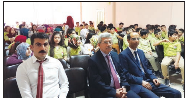
Mezitli İmam Hatip Ortaokulu öğrencileri.

Mersin BST İl Müdürlüğü 2016 Verimlilik Haftası kapsamında 2 etkinlik düzenledi.