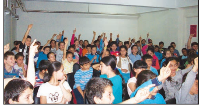
Manisa Şehitler Ortaokulu

Tasarrufu Nedir, Enerji Tasarrufunun Gerekliliği, Aydınlatmada Enerji Tasarrufu ve Verimliliği Nasıl Sağlanır" konularında öğrencileri bilgilendirdi/