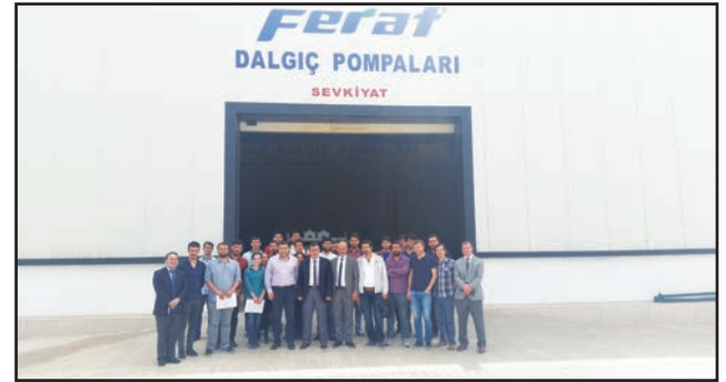
Ferat Pompa'ya düzenlenen teknik geziye katılan öğrenciler.