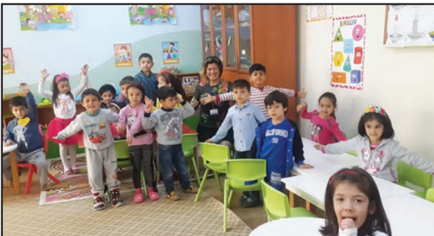
Ordu Perşembe Cumhuriyet İlkokulu Anasınıfı öğrencilerine asansörü doğru kullanma sunumu yapıldı.

28 Nisan 2016 tarihinde Ordu Perşembe Cumhuriyet İlkokulu'nda 25 anasınıfı öğrencisine güvenli asansör kullanımıyla ilgili olarak