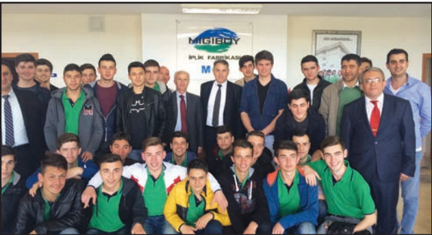
Migiboy Tekstil firmasına düzenlenen teknik geziye katılan öğrenciler

28 Nisan 2016 tarihinde Kırklareli Fen Lisesi ziyaret edilerek öğrenciler zamanın verimli kullanımı konusunda bilgilendirildi. Verimlilik Haftası tanıtım filminin de izletildiği etkinlikte