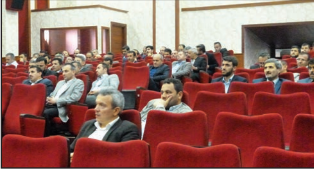
Rize Müftülüğü Yusuf Karali Dini Yüksek İhtisas Merkezi Konferans Salonu

4 Mayıs 2016 tarihinde Rize Müftülüğü Yusuf Karali Dini Yüksek İhtisas Merkezi'nde gerçekleştirilen konferansa Merkez Müdürü, öğretim görevlileri, Samsun, Erzurum, Bayburt, Gümüşhane, Tokat'tan gelen din görevlileri katıldılar.