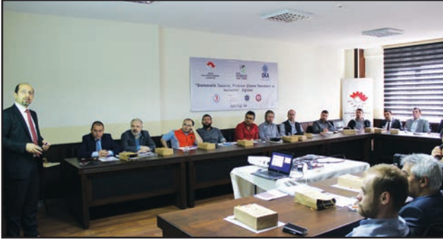
Samsun - Sistematik Tasarım, Yaratıcı Problem Çözme ve Verimlilik Eğitimi – OMÜ Yeşilyurt Demir Çelik Meslek Yüksekokulu

Samsun BST İl Müdürlüğü 2016 Verimlilik Haftası kapsamında 1 etkinlik düzenledi.