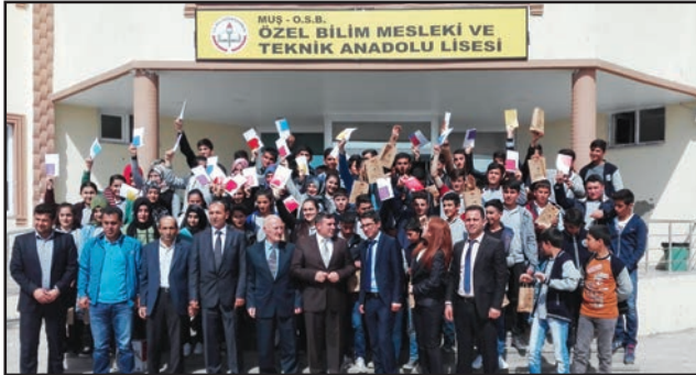
Muş OSB Özel Bilim, Meslek ve Teknoloji Anadolu Lisesi öğrencileri.

27 Nisan 2016 tarihinde Muş OSB Özel Bilim, Meslek ve Teknoloji Anadolu Lisesinde "Çevre Bilincinin Oluşturulması ve Verimli Ders Çalışma" konulu bir etkinlik düzenledi.