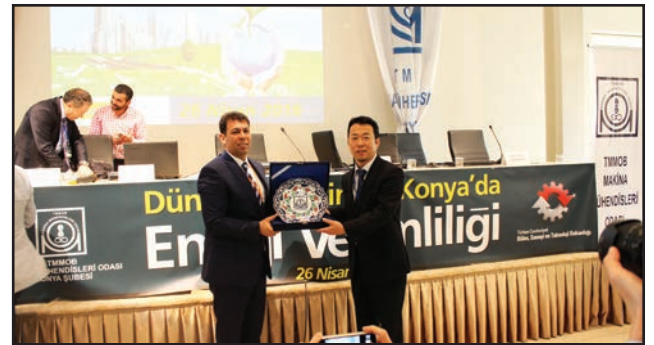
Panelistlere Konya hatırası olarak hediye takdim edildi.

Yalın Üretim, Enerji Verimliliği, Akıllı Şehir Tasarımı ve Kaizen Yönetimi temalarının işlendiği ve katılımın çok yüksek olduğu panel, sanayiciler, akademisyenler, belediye yetkilileri, sivil toplum kuruluşları mühendislik fakültesi öğrencileri tarafından ilgiyle izlendi.