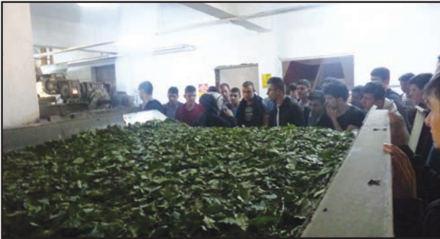
Çaykur Cumhuriyet Çay Fabrikası teknik gezi

Rize BST İl Müdürlüğü, Tefvik İleri Teknik ve Endüstri Meslek Lisesi öğretmen ve öğrencileri için 17 Mayıs 2016 tarihinde Çaykur Cumhuriyet Çay Fabrikasına bir teknik gezi düzenledi. İşletme yetkilileri tarafından öğretmen ve öğrencilere çayın üretim süreciyle ilgili bilgiler aktarıldı.